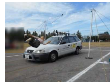
(ダミー人形の衝突実験)