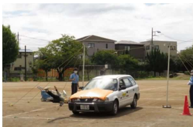
(ダミー人形の衝突実験)