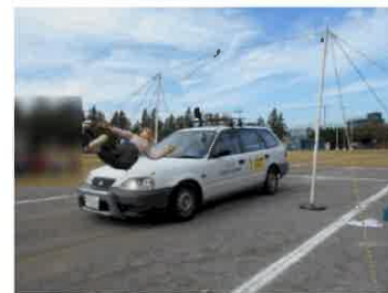
(ダミー人形の衝突実験)