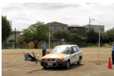
(ダミー人形の衝突実験)