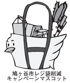
鳩ヶ谷市レジ袋削減キャンペーンマスコット

今後、事業者・市民一体となって、環境にやさしい生活に取り組みましょう。 問合せ 廃棄物対策課 ☎ 281・5043