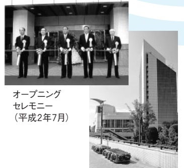
川口に「文化情報発信の拠点を」と川口総合文化センター・リリアをオープン