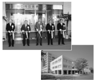
救命救急センターや新生児集中治療室などを備え、市域を超えた総合医療拠点として整備された医療センター(平成6年5月)