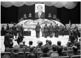
別れを惜しみながら祭壇に花を捧げる参列者のかたがた