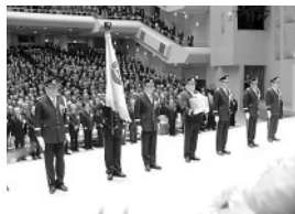
儀礼隊により祭壇に安置されるご霊位