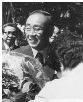
市長として初登庁(昭和56年6月)