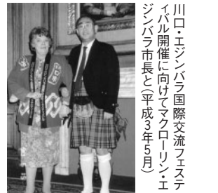
川口・エジンバラ国際交流フェスティバル開催に向けてマクローリン・エジンバラ市長と(平成3年5月)