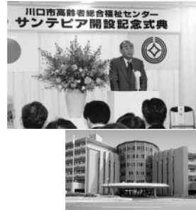
来るべき高齢化社会に向けて、誰もが健康で幸せに暮らせるまちを目指して、高齢者総合福祉センター・サンテピアを開設(平成9年4月)