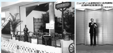
「ニューデール作戦川口」官民共同で鋳物製品を売り込みました(昭和62年4月～)