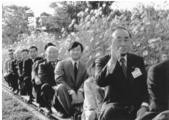
全国都市緑化さいたまフェア'87で皇太子殿下はグリーンセンターを視察、永瀬氏が案内人を務めました(昭和62年10月)