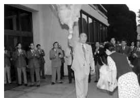
市長退任で本庁舎前にて花束を受ける(平成9年5月)