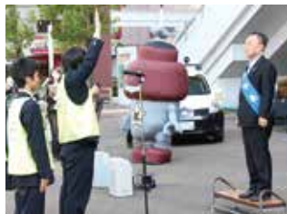
4月12日に行われたかわぐちRunRunパトロール出発式