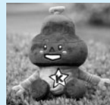
きゅぼらんぬいぐるみ