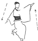
図11 左手を袖に揃えて竿(右手手ぬぐいを) 後ろに「一・二・三」と釣り上げる