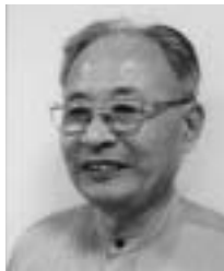
マンション管理評論家 村井忠夫氏