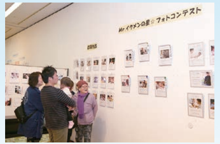
※アンケートにご協力いただいたかたに粗品プレゼント

問い合わせ…総合政策課男女共同参画社会担当 〒332-0015 川口1-1-1 キュポ・ラム4階 ☎048-227-7605 (火～土9:30～18:15) FAX048-226-7718