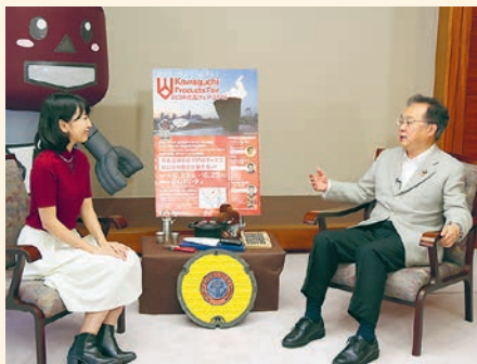
市広報番組「ふれあい川口」10月号で「川口市産品フェア2015」をPR

私は、このフェアを通じた地元企業の育成や振興の取り組みが乗数効果をもたらし、地産地消を機軸とした市内経済の好循環を促進するものと確信しています。さらには市外や海外への販路拡大などの発展も期待しているところです。 また、会場では地場産業の植木・花きを中心とした「花と緑の販売コーナー」や市内で生産された食品などを紹介する「かわぐちグルメコーナー」をはじめ、もの