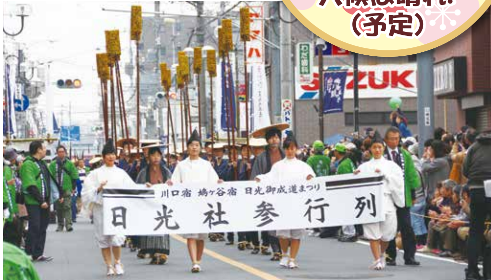
日光社参行列(鳩ヶ谷宿)