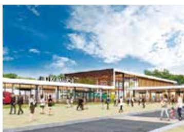
イメージ図(設計中)