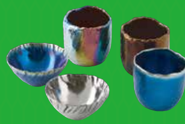
チタン鑄造 チタン盃