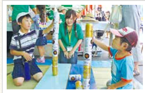
子どもチャレンジ広場