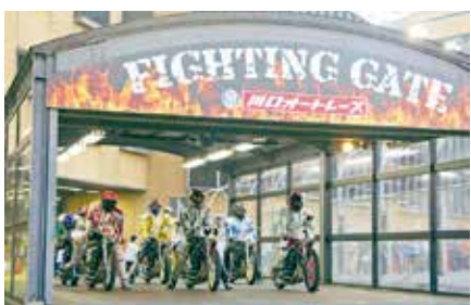
模擬オートレース

オートレース場とその周辺で開催。会場では、流し踊りや花火などたくさんのイベントが開催され、2日間で31万人もの来場者で賑わいました。