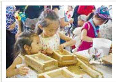
鋳物実演コーナー