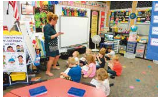
▲5歳～7歳の子どもが学ぶプライマリースクール