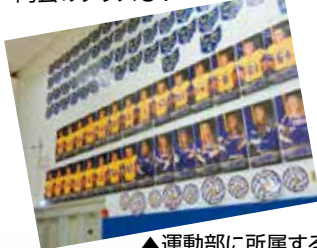
▲運動部に所属する生徒たち