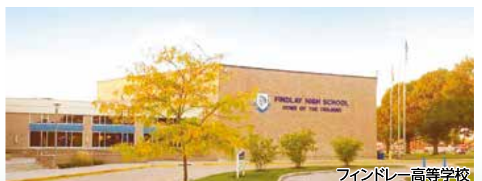
フィンドレー高等学校