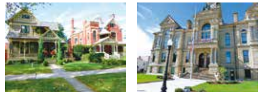
▲古きよきアメリカの面影が残る街並み