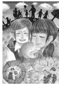
中学生・一般の部 最優秀作品