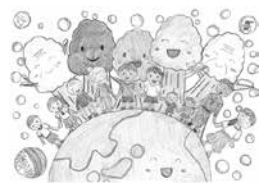
小学生の部 最優秀作品

2千248作品から最優秀賞、優秀 賞、佳作が選ばれました。福祉刊 行物などに使用し、福祉の日をP Rします。