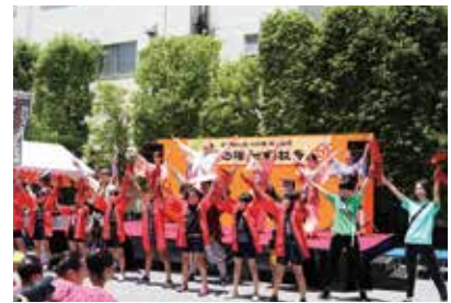
元氣川口・御成道サンバPV