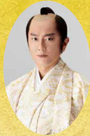
はらだ りょうじ 原田 龍二さん