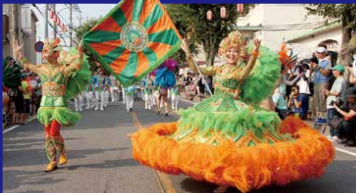
15 サンバパレード 9/1日 16:30 ~ 18:00