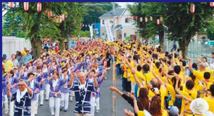
14 流し踊り 9/1日 14:30 ~ 16:00