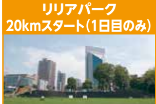
リリアパーク 20kmスタート(1日目のみ)