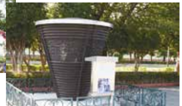
川口市聖火台(青木町公園)