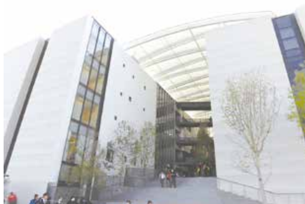
▲川口市立高等学校

★時間・申込方法などの詳細はホームページをご覧ください。 https://kawaguchicity-jh.edumap.jp