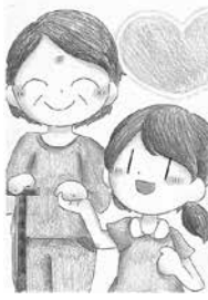
中学生・一般の部