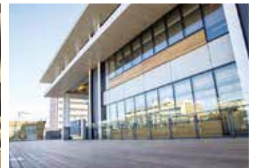
ペデストリアンデッキ