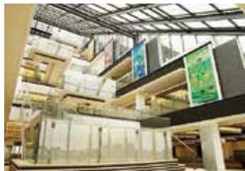
シビック・キューポラ