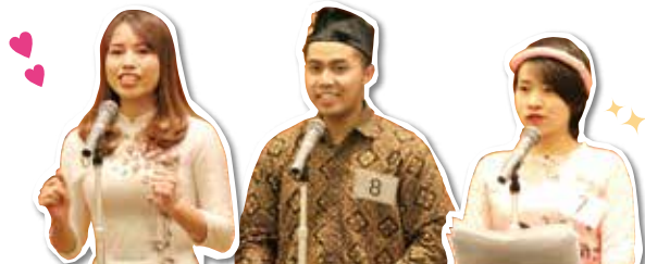
※[第11回川口市外国人による日本語スピーチコンテスト]参加者の皆さん