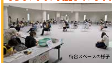
待合スペースの様子