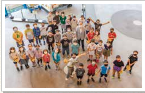
苗植式に参加した4年2組の皆さん