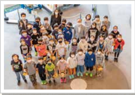
苗植式に参加した4年1組の皆さん