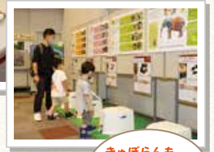
きゅぼらんも遊びに行ってきたきゅぼ!