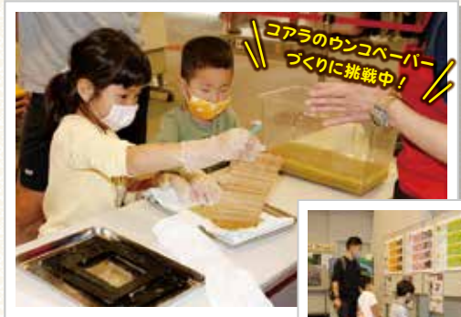
コアラのウンコベーパークリに挑戦中!