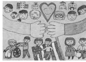
小学生の部 最優秀作品

テーマ：手伝います 少しの勇気でみな笑顔 1千250作品の中からそれぞれ最優秀賞、優秀賞、佳作が選ばれました。入賞作品のうち、小学生の部(写真右)、中学生・一般の部(写真左)でそれぞれ最優秀賞が選ばれました。福祉刊行物などに使用し、福祉の日をPRします。