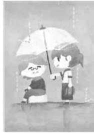
中学生・一般の部 最優秀作品