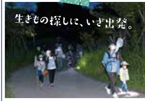
大きなカブトムシ~