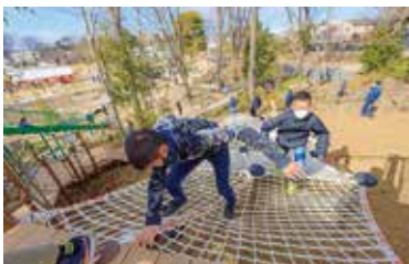
近隣の小学校の児童が一足先に体験

今後は温室の建替えや大集会堂の改修などが続きます。私は市民の憩いの場として最も親しまれているこのグリーンセンターが、本市の豊かな自然と歴史を守りながら新しく生まれ変わるにより、さらに多くの家族連れで賑わい、花と緑と笑顔あふれる魅力的な施設となるよう、引き続き取り組み組んでまいります。