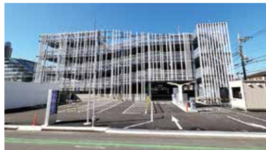
出入口前の道路は一方通行です。お帰りの際は左折のみとなります。歩行者に注意して出庫してください。

開場時間 ▶ 8:00~18:00 (入庫は17:15まで) 休場日 ▶ 土・日曜、祝日