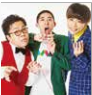
怪奇! Yes どんぐり RPG