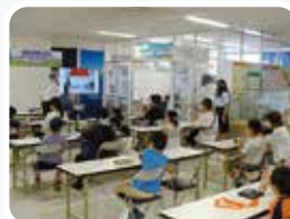
ソーラーランタンづくり