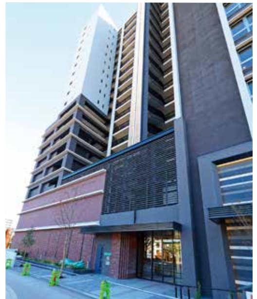
行政センター正面入口

災害に強い施設として、マンホールトイレ、かまどベンチ、停電時でも使用できるLPガスを燃料とした空調設備(一部の部屋のみ対応)を設置します。