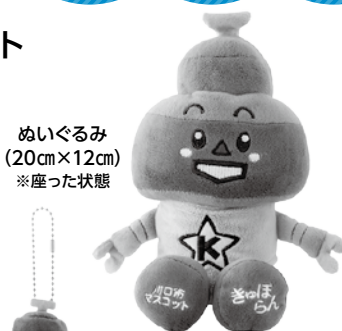
ぬいぐるみ (20cm×12cm) ※座った状態