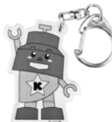
アクリル キーホルダー (4.5cm×3.5cm)