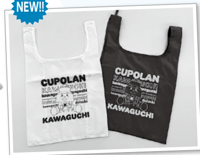
エコバッグ(28cm×28cm) ※持ち手含まず