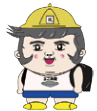
川口市経済部産業振興課 公式キャラ「まご兵衛」