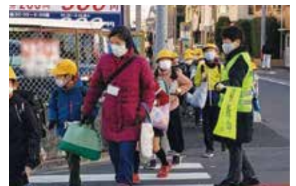
登下校時の声掛けの様子

A 高齢者や障害のあるかたを訪問したり、高齢者や子育て世代が集まるサロン活動、子どもたちの安全を見守るための登下校時の声掛けなどを行っています。