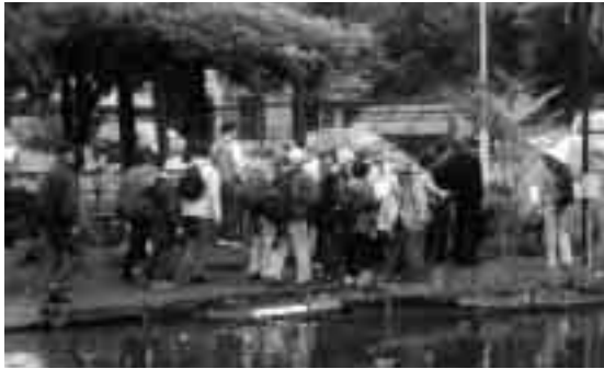
写真は、草加市の歴史愛好会の方々に桜町湧水公園（桜1）を案内しているようすです。 問合せ 鳩ヶ谷郷土史会・花岡☎281-3509