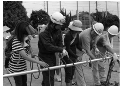
▶ 資機材取扱訓練 ▶