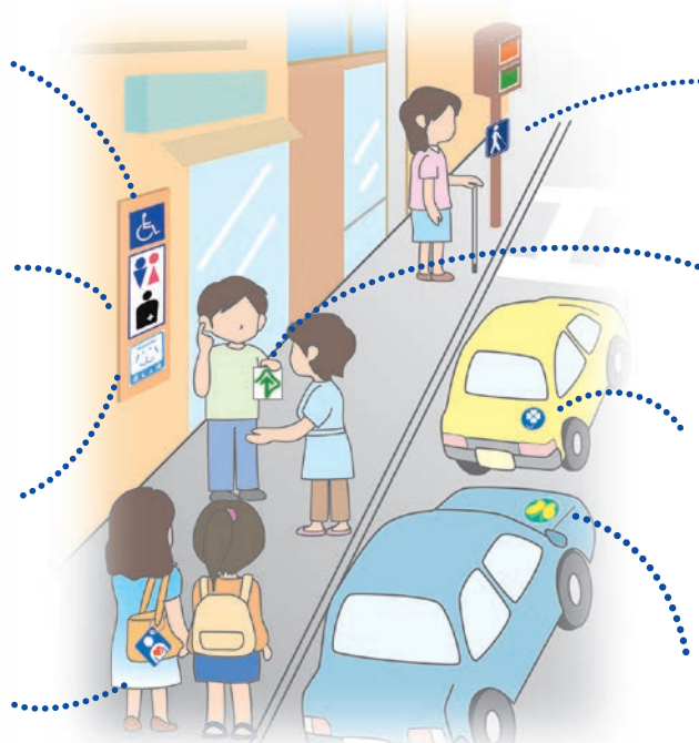
(マークの表示場所は一例です)