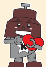
川口市マスコット「きゅぼらん」