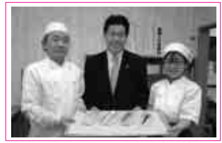
丸十まえのベーカリー（桜5）

は〜とふる訪問は、市内で活躍する企業や個人を市長が訪問し、地域の課題等について意見交換を行い、協働のまちづくりの推進と地域の活性化を図ります。