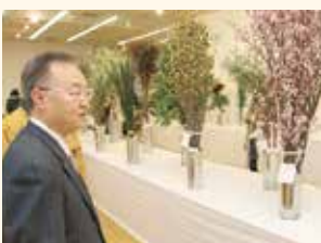
知ろう・使おう・広げよう

具体的には、10月23日から25日まで「知ろう・使おう・広げよう」をテーマに「川口市産品フェア2015」を開催します。これは本市の铸件や機械などの工業製品をはじめ、安行の植木や花卉など日用品や農産物を含めた製品を一堂に集め、ものづくりのまち川口を大いにPRするものです。みなさんにも市産品を知っていただき、良いものは買って、使って、広めていただきたいと考えております。