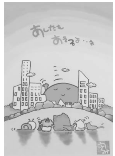
絵・うさみのぶこ