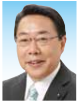
塩野 正行(52歳) 公明党