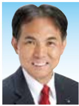
村岡 正嗣(63歳) 日本共産党