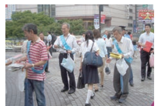
青少年非行防止キャンペーン