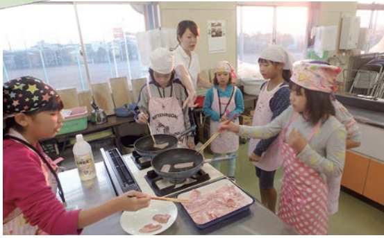
公民館で3泊4日寝泊りし学校へ通う「通学合宿」。親元から離れ、みんなで協力して集団生活を行ないます。