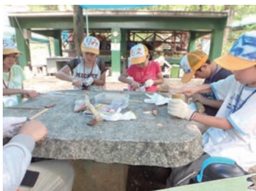
子ども自然体験村

夏休みに、埼玉県青少年総合野外活動センターで4泊5日のキャンプを行います。小学5年生と中学生を対象に、異なる年齢と交流しながら、自然や環境への理解を深め、自主性や協働性、忍耐力などの心を育みます。