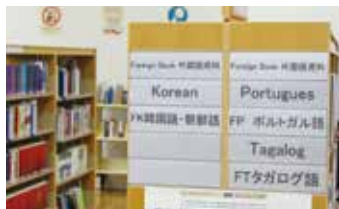
外国語図書コーナー

国際化社会に対応するため、英語のほか中国語、韓国語・朝鮮語、ポルトガル語など外国語の図書コーナーを設置しています。