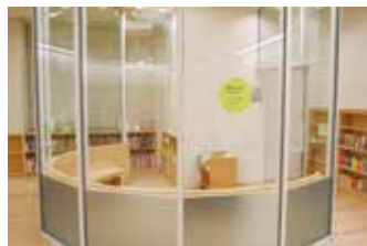
赤ちゃんコーナー

子どもの本コーナーは、天井が低く声が響きにくい構造です。一般の閲覧スペースから独立しているため、親子で楽しく利用できます。また、赤ちゃんの泣き声が周囲に漏れにくい赤ちゃんコーナーもあります。