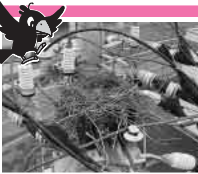
▲針金ハンガーなどで、カラスが電柱に作った巣の写真

また、ハンガーを持ち去られないよう注意してください。安全確保のため、ご協力をお願いします。