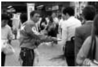
選手によるボランティア活動

道路整備や小・中学校の体育用具など、さまざまな分野で生かされています。また、選手によるボランティア活動や野球教室の開催など地域のための取り組みも積極的に行われています。