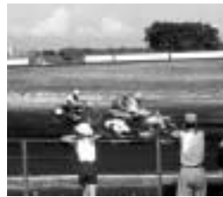
ダートコース時代の川口オートレース場

公営競技の一つオートレースが行われています。最初は石炭ガラのダートコースでしたが、昭和42年に一周500mの舗装された走路に変更。かつては2輪車・4輪車のレースがありましたが、現在は2輪車だけとなり、時速150kmを越える熱いドラマが繰り広げられています。たたら祭りの花火会場にもなります。