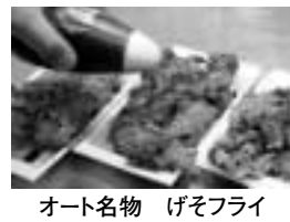
オート名物 げそフライ