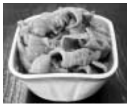
伝統の味 もつ煮込