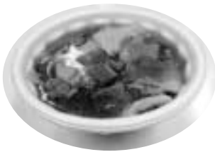
懐かしい味 すいとん