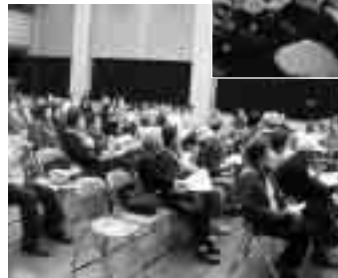
▲スクリーンをバックにテンポ良くストーリーを語る活弁士