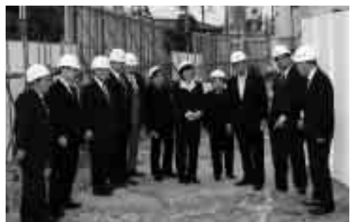
不発弾問題調査特別委員会による現場視察

市議会では、3発目の処理後に安全化宣言をしたにもかかわらず、4発目の不発弾が発見されたことを重く受け止め、3月23日（火）に開催された3月定例会市議会において、議員提出議案として「不発弾問題調査特別委員会の設置」を議会に上程し、全会一致で可決・成立しました。