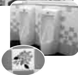
写真右：壁には、桜町小学校にちなみ「桜の花のタイル」を貼りました

5・6年生の代表8人の児童と校長先生等で「みんなで作るトイレ検討委員会」を設置し、アンケートを取りまとめ、市担当者や設計工事業者を交えて意見交換を行い、全体が明るく清潔感のあるトイレを目指しました。 会議では特に「臭い・汚い・暗い」というイメージをどうしたら解消できるのかを考え、ピンク、青、赤などみんなの好きな色を取り入れた壁や扉にした結果、委員は「想像した以上に明るく清潔感のあるトイレができ、とても嬉しいです。」と話してくれました。 今後もみんなのトイレとして、大切に使用してほしいですね。