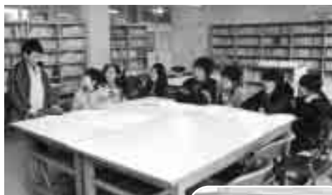
写真上：委員の子どもたち