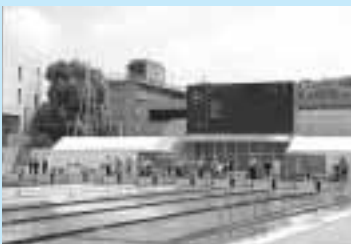
「彩夏到来08埼玉総体」 高校総体(インターハイ)ソフトテニス競技・水泳競技・飛び込み競技が、青木町公園で行われ、全国から選り抜かれた選手たちが熱戦を繰り広げました。