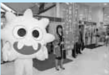
県内初レジ袋 無料配布中止の取り組み

11月10日「川口の日」から市内12事業者、19店舗で、レジ袋の無料配布中止を一斉に実施。スーパーでは買い物客に「お買い物にはマイバッグを!」と環境負荷削減への協力を呼びかけました。