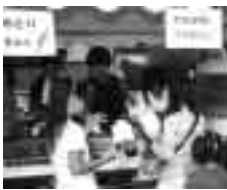
(写真は昨年の鳩ヶ谷まつり)

市では、「第4回鳩ヶ谷まつり」の実行委員とサポーターを募集します。市民の皆様が主体となり、子どもからお年寄りの方まで市民総参加で楽しめる場となる「まつり」を作りたいと、熱意あふれる市内の個人・団体の方、ふるってご応募ください。応募方法 受け付けは随時、はがき・Eメール・FAXなどで、住所、氏名、電話番号を記入のうえ、お申し込みください。